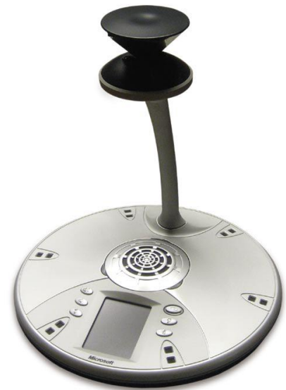
Forbundet til telefonnettet kan Microsoft RoundTable også anvendes som en almindelig konferencetelefon